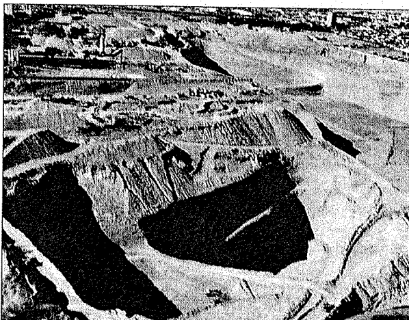
فیلم سرنجام غول‌های شنی را در هم افزا ببینید.

کارگرانی که همچنان در معادن مشغول به فعالیت هستند برای انجام عملیات طرح به کار گرفته خواهند شد.